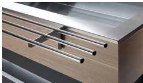
Mensole a richiesta Shelves on demand